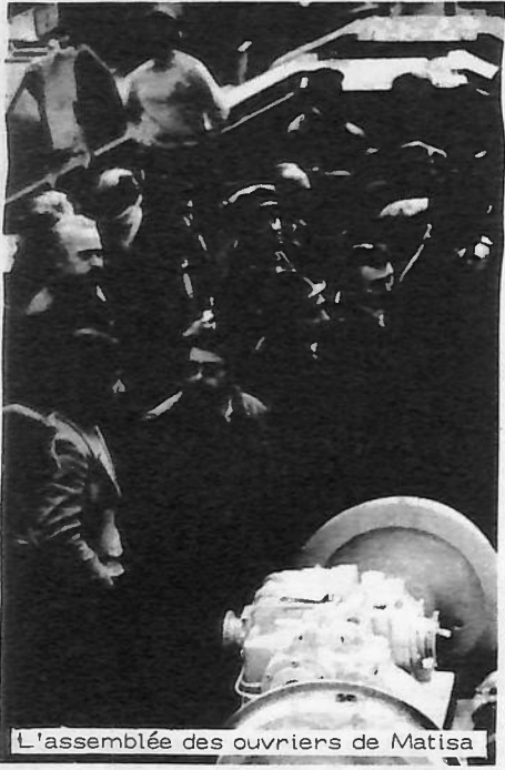
L'assemblée des ouvriers de Matisa

L'assemblée générale, grévistes et non grévistes réunis (car le rapport de force interne ne permet pas de les écarter des votes), doit se tenir l'après-midi à 15h et prendre position par rapport à la proposition de l'Office faite la veille. En laissant aux ou-