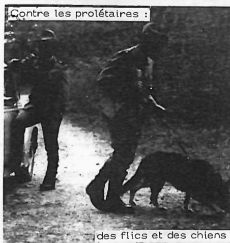
me le PS ou le PdT prönet un plus strict contrôle de l'immigration.

( 1 ) Le dernier exemple flagrant des ravages du chauvinisme entretenu par les organisations politiques et syndicales réformistes est celui du vote des ouvriers des usines métallurgiques de Vallorbe qui à la majorité demandèrent que les travailleurs frontaliers et les autres étrangers soient les premières victimes du plan d'assainissement de la direction prévoyant dans un premier temps une quarantaine de licenciements. La FTMH était évidemment dans le coup.