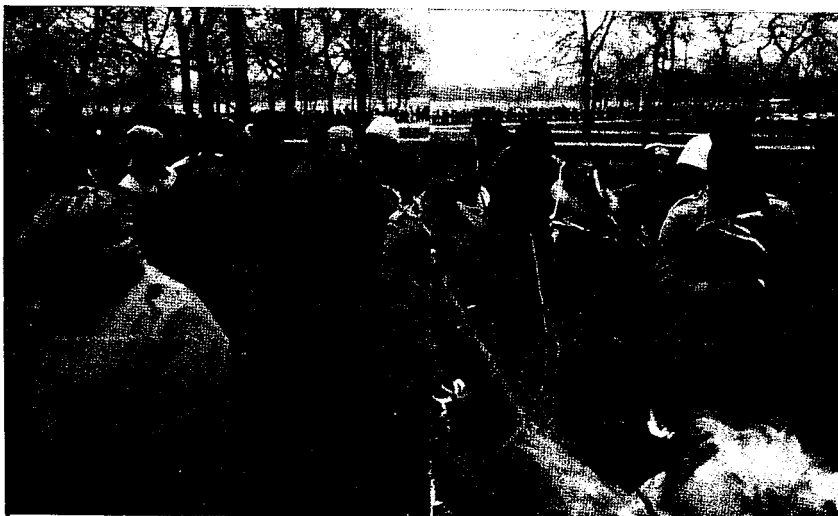
1983 Αμερικάνοι ανεργοί περιμένουν υπομονετικά στην τερμ- στια ουρά, με την ελπίδα ότι θα βρουν κάποια δουλειά στο υπαίθριο γραφείο εργασίας...

Αυτό το άρθρο γράφτηκε στις αρχές του 1982 από αμερικάνο σύντροφο κι είναι το Ιο μέ- ρος μιάς προσπάθειας παρουσίασης της κατάστασης ζωής κι εργασίας του αμερικάνικου προλεταριά- του. Ενός μητροπολιτικού προλεταριάτου, του πιδ μεγάλου ιμπεριαλιστικού κράτους, που έχει να παίξει ένα σημαντικό κι αποφασιστικό ρόλο στην παγκόσμια ταξική πάλη κι επαναστατική διαδι- κασία.