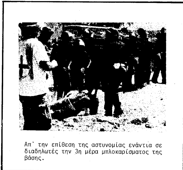
Απ' την επίθεση της αστυνομίας ενάντια σε διαδηλωτές την 3η μέρα μπλοκαρίσματος της βάσης.

Στις 7 Αυγούστου πάρθηκε μια άλλη κοινή πρωτοβουλία: διαδήλωση συμπαράστασης στη Νικαράγουα (πρόταση της ΙΜΑΚ και ιδιαίτερα του ΙΚΚ). Οι "αντιθεσμικοί" προσχώρησαν με στόχο να διευρύνουν την επέμβαση με θέματα πιο πολιτικά σχετικά με την πάλη ενάντια στους ιμπεριαλισμούς. Με αυτήν τη διεύρυνση δεν συμφωνούσαν οι "θεσμικοί" που ξεκίνησαν την διαδήλωση με στόχο αντιιμπεριαλισμού και για να απομονώσουν τους "αντιθεσμικούς". Οι ειρηνιστές παίρνοντας υπόψη ότι το κίνημα είναι σύνθετο, δηλ. συγκροτημένο από ομάδες διαφορετικών ιδεολογικών προελεύσεων και πολιτικών τροχιών που σαν τέτοιες είναι ασυμβίβαστες και ότι όλοι αυτοί θέλουν να παλαίσουν για τον ίδιο επιμέρους στόχο, προσπαθούσαν να επιλέξουν ορισμένα τμήματα των ειρηνιστών, βάζοντας από την αρχή ιδεολογικές προϋποθέσεις του τύπου: αποδοχή της αρχής της μη βίας σαν συνολικής φιλοσοφίας και όχι (όπως υποστηρίχτηκε από την πλειοψηφία των "αντιθεσμικών") σαν μέθοδο μιας επιμέρους και συγκυριακής πάλης που θα αποφασίζεται στη