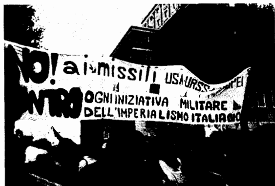
Διαδήλωση "Όχι στους πύραυλους ΕΠΑ-ΕΣΣΔ-Ευρώπης ενάντια σε κάθε στρατιωτική πρωτοβουλία του ιταλικού ιμπεριαλισμού".

Η ανάπτυξη του ειρηνιστικού, αλλά και παράλληλα του οικολογικού κινήματος στη Δ. Ευρώπη είναι φαινόμενα που χαρακτηρίζουν την υπερανάπτυξη και σήψη του καπιταλισμού στο ψηλότερο στάδιο του, τον ιμπεριαλισμό. Ο καπιταλισμός καταστρέφει τη φύση, απειλεί να καταστρέψει και την ανθρώπινη ζωή. Ενάντια σε αυτές τις απειλές που είναι υπαρκτές , αναπτύχθηκε μια κοινωνική διαταξική δράση που είχε σα στόχο να αποτρέψει ή να επιβραδύνει τουλάχιστον τις συνέπειες της καταστροφικής πορείας του καπιταλισμού. Από την ίδια του την κοινωνική σύνθεση αλλά και τις ιδεολογικο-πολιτικές αντιλήψεις και τρόπους δράσης τους τα κινήματα αυτά δεν αμφισβητούν βέβαια τον καπιταλισμό. Συγκροούνται όμως με αυτόν καθώς με τους δημοκρατικούς τρόπους δράσης (ειρηνικός αποκλεισμός