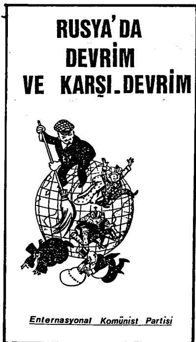
έντυπο της οργάνωσης στα τούρκικα

Elections européennes et situation politique Mouvements de la paix: premières constatations et axes d'orientation La crise du Parti France: la Gauche contre la classe ouvrière Espagne '36: le rôle contre-revolutionnaire de la démocratie