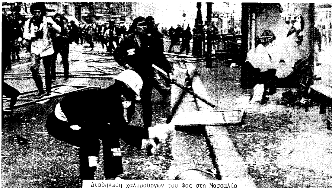
Διαδήλωση χαλυβουργών του Φος στη Μασσαλία

Με τη δημοσίευση του σχεδίου για το ατσάλι (που περιλαμβάνει 20.000 απολύσεις στην αρχή...) η κυβέρνηση της Αριστεράς επιτίθεται μετωπικά στην εργατική τάξη: "ή θα περάσει ή θα χτυπήσουμε" είναι το σύνθημα. Αυτό σημαίνει ότι προετοιμάζεται να χρησιμοποιήσει την πιο άμεση καταστολή σε περίπτωση που οι διαδηλώσεις οργής θα ξεπεράσουν τα όρια. Όλα αυτά συνδυάζονται με ύ-