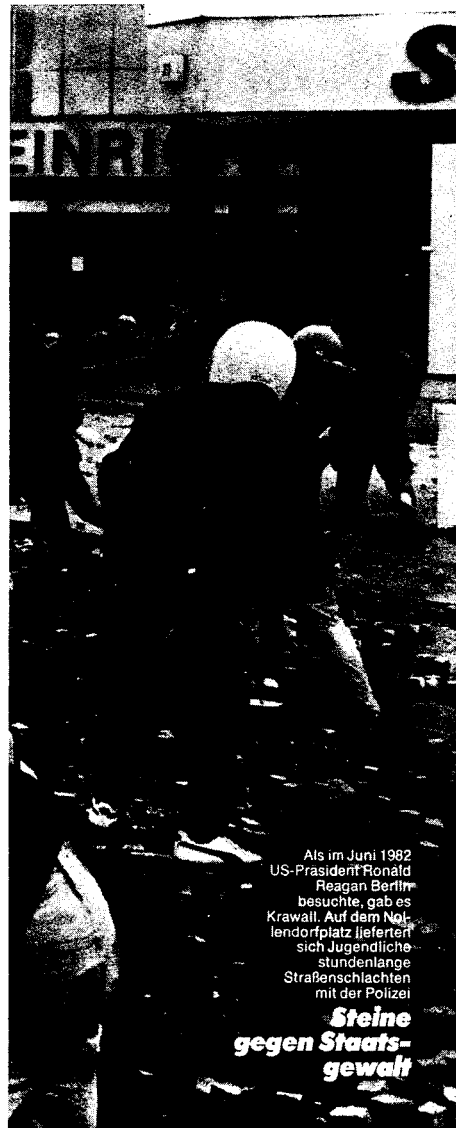
Als im Juni 1982 US-Präsident Ronald Reagan Berlin besuchte, gab es Krawall. Auf dem Nikolanderplatz lieferten sich Jugendliche stundenlang Straßenschlachten mit der Polizei

β) να δείξει τη συνεργία των αστικών τάξεων & των κυβερνήσεων Ελλάδας-Τουρκίας στην καταδίωξη των πολιτικών προσφύγων που καταφεύγουν στην Ελλάδα. Στην Τουρκία του Εβρέν φυλακίζονται και εκτελούνται, στην Ελλάδα του ΠΑΣΟΚ, όπως και επί δεξιάς, κλείνονται στο στρατόπεδο συγκέντρωσης στο Λαύριο, απαγορεύεται η ανοικτή πολιτική δράση για να μην παρενοχλούνται οι διπλωματικοί ελληνοί της κυβέρνησης ΠΑΣΟΚ, δεν έχουν πολιτικά δικαιώματα, άδεια εργασίας κλπ.