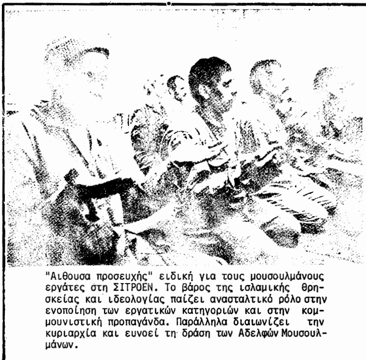
"Αιθουσα προσευχής" ειδική για τους μουσουλμάνους εργάτες στη ΣΙΤΡΟΕΝ. Το βάρος της ισλαμικής θρησκείας και ιδεολογίας παίζει ανασταλτικό ρόλο στην ενοποίηση των εργατικών κατηγοριών και στην κομμουνιστική προπαγάνδα. Παράλληλα δαιμονίζει την κυριαρχία και ευνοεί τη δράση των Αδελφών Μουσουλμάνων.

Υπάρχουν δυο τάσεις Αδελφών Μουσουλμάνων. Η πρώτη που λέγεται Τεκφίρ είναι αυτοί που λένε ότι τα κράτη της Β. Αφρικής και όλα τα κράτη που υπάρχουν ισλαμιστές πρέπει να είναι θεοκρατικά. Επίσης αναφέρονται στον προφήτη των μουσουλμάνων ιστορικά συνδέοντας το ταξίδι του προφήτη από τη Τζέντα στη Μέκκα με τη μετανάστευση από πλευράς προπαγάνδας. Πάνω σε αυτήν την ιδεολογικοθρησκευτική αναλογία έχουν κτίσει όλο τους το πολιτικό σκεπτικό για την Ευρώπη και τους άλλους μη ισλαμικούς λαούς και σε αυτή τη βάση δουλεύουν στους μετανάστες. Η πηγή της τάσης αυτής ήταν στην Αίγυπτο