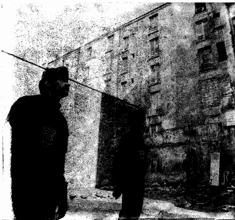
"Σοσιαλιστική" καταστολή και κατοχή της νησίδας Σαλόν στο Παρίσι, από τα CRS (γαλλικά MAT) με στόχο να διώξουν τους ένοικους (εργάτες μετανάστες, άνεργους νεολαίους) που είχαν καταλάβει πολλά σπίτια.

Οι οργανώσεις αυτές έχουν διαλυθεί πανευρωπαϊκά. Μέσα από τη διάλυση τους έχουν συγκροτηθεί ομάδες που βάζουνε πιο προχωρημένα. Για παράδειγμα τώρα πια βάζουνε θέμα ότι η Ρωσία είναι ιμπεριαλιστική ενώ μέχρι σήμερα δεν δεχόντουσαν κάτι τέτοιο. Μιλάνε ακόμα για διεθνείς διασυνδέσεις και διεθνή οργάνωση. Όλα αυτά είναι αναμφισβήτητα θετικά.