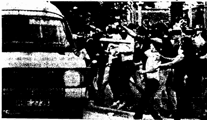
Απεργοί ανθρακωρύχοι με πέτρες ενάντια στην αστυνομία.

Με τη λήξη της απεργίας των εγγλέζων ανθρακωρύχων είναι απαραίτητο να βγούμε ορισμένα συμπεράσματα από την σκληροτράχηλη αυτή πάλη, που αφορούν τα αίτια της ήττας, ότι θετικό κατακτήθηκε στη διάρκεια του αγώνα και τα πολιτικά προβλήματα που έβαλε .