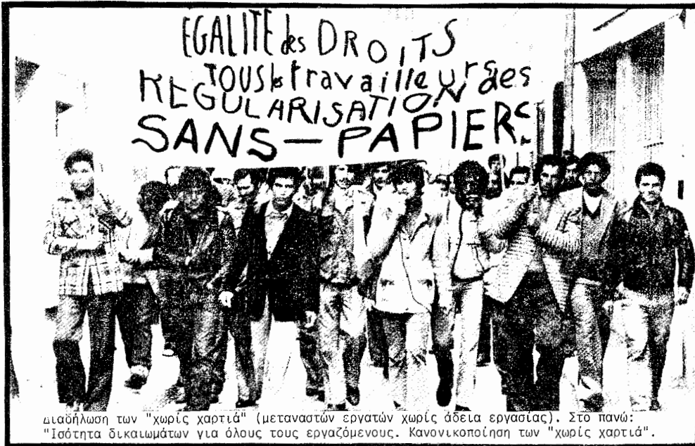
Μιαδήλωση των "χωρίς χαρτιά" (μεταναστών εργατών χωρίς άδεια εργασίας). Στο πάνω: "Ισότητα δικαιωμάτων για όλους τους εργαζόμενους. Κανονικοποίηση των "χωρίς χαρτιά".

Ο σύντροφος μίλησε για την κατάσταση των μεταναστών στη Γαλλία με βάση δυο ιδιότητες: α) σαν στρατευμένο άτομο στη μετανάστευση δηλ. μέσα σε μια δουλειά που γίνεται για το θέμα αυτό σε όλα τα επίπεδα και σαν μετανάστης ο ίδιος και β) σαν κομμουνιστής βλέποντας σαν στόχο την ποιοτική αλλαγή της γαλλικής κοινωνίας.