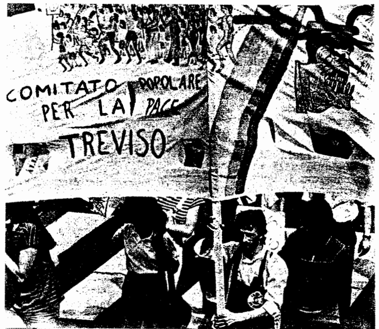
Η "Λαϊκή Επιτροπή για την Ειρήνη" του Τρεβίζο-Ιταλίας σε κινητοποίηση ενάντια στη συνάντηση της Ρώμης της Δυτικοευρωπαϊκής Ενωσης. (Οκτώβριος 1984)

Η πλατεία από την αρχή της διαδήλωσης ήταν χωρισμένη σε δυο κομμάτια, αν και το καθένα από αυτά δεν ήταν εντελώς ομοιογενές. Το ένα κομμάτι συγκροτιόταν από το χώρο των "λαϊκών επιτροπών" και των "αντιμιλιταριστικών οργανισμών" (οι τελευταίοι αναφέρονταν στο μεγαλύτερο μέρος τους στην Αυτονομία), το άλλο από το χώρο του "Εθνικού Συντονιστικού των Επιτροπών για την Ειρήνη", ΙΚΚ, συνδικάτα, Προλεταριακή Δημοκρατία και μια σειρά λαϊκών Επιτροπών Ειρήνης που είχαν μερικούς