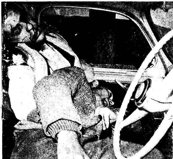
Ο τουρκοκύπριος Καβάζογλου και ο ελληνοκύπριος Μισσούλης δολοφονήθηκαν από την τουρκική φασιστική οργάνωση TMT με συνεργασία της ΕΟΚΑ Β.

Οι αποφασιστικές αντιστάσεις που υπήρχαν εκείνη την περίοδο τόσο από την πλευρά της ελληνοκυπριακής όσο και της τουρκοκυπριακής κοινότητας κτυπήθηκαν από τις εξτρεμιστικές οργανώσεις TMT και ΕΟΚΑ. Είναι γνωστές οι δολοφονίες των συνδικαλιστών Φαζίλ Οντέλ και Ντερβής Καβάζογλου από την TMT καθώς και το κυνηγητό στελεχών του ΑΚΕΛ από την ΕΟΚΑ. (6)