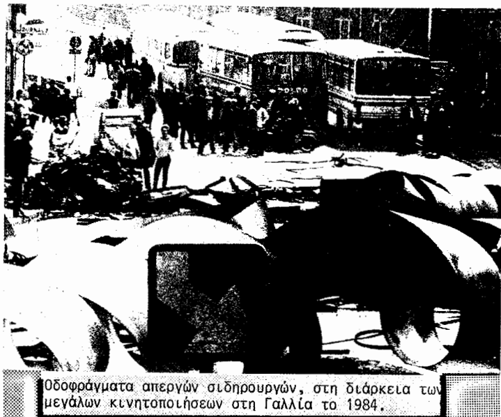
Οδοφράγματα απεργών σιδηροδρόμων, στη διάρκεια των μεγάλων κινητοποιήσεων στη Γαλλία το 1984.

Όσοι έχουν απομείνει απο τις μαοϊκές οργανώσεις & ιδιαίτερα απο Κ.Κ.Γ.(μ-λ) έχουν κάνει μια δουλειά στην δεύτερη γενιά μεταναστών βάζοντας το θέμα σε μια πολυεθνική βάση λέγοντας δηλ. ότι η Γαλλία σήμερα δεν είναι μια καθαρά γαλλική κοινωνία αλλά ότι υπάρχουν διάφορες εθνότητες μέσα σε αυτήν. Προσπαθούν λοιπόν να βάλουν στις διάφορες πόλεις-δορυφόρους που βρίσκονται γύρω απο τις μεγάλες πόλεις το ζήτημα του πως θα μπορούσαν να συμπεριφερθούν οι μετανάστες της β' γενιάς σε μια τέτοια κοινωνία. Το πρόβλημα είναι ότι τα πάντα παραμένουν σε επίπεδο συζήτησεων και δεν υπάρχει καμιά