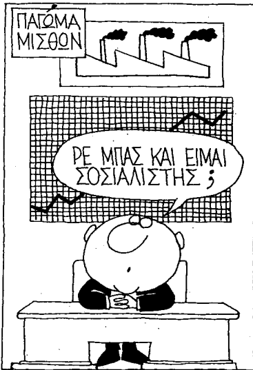
ΚΥΡ ΕΛΕΥΘΕΡΟΤΥΠΙΑ 9-11

■ Ο θάνατος Κανελλόπουλος βγήκε παραμονές 28ης Οκτώβρη να μας θυμίσει την... εθνική έξαρση... εκείνων των ημερών και να μας καλέσει να αποδεχτούμε τα μέτρα όσο οδυνηρά και αν είναι... για όλους μας. Προφανώς ο θαυματοποιός γεροξεκούτης που κατάφερε κάποτε να κάνει το Μακρονήσι "Παρθενώνα", χάνει και αυτός από τα μέτρα αφού ζει αποκλειστικά από τη... φτώχη του συσταξούλα!